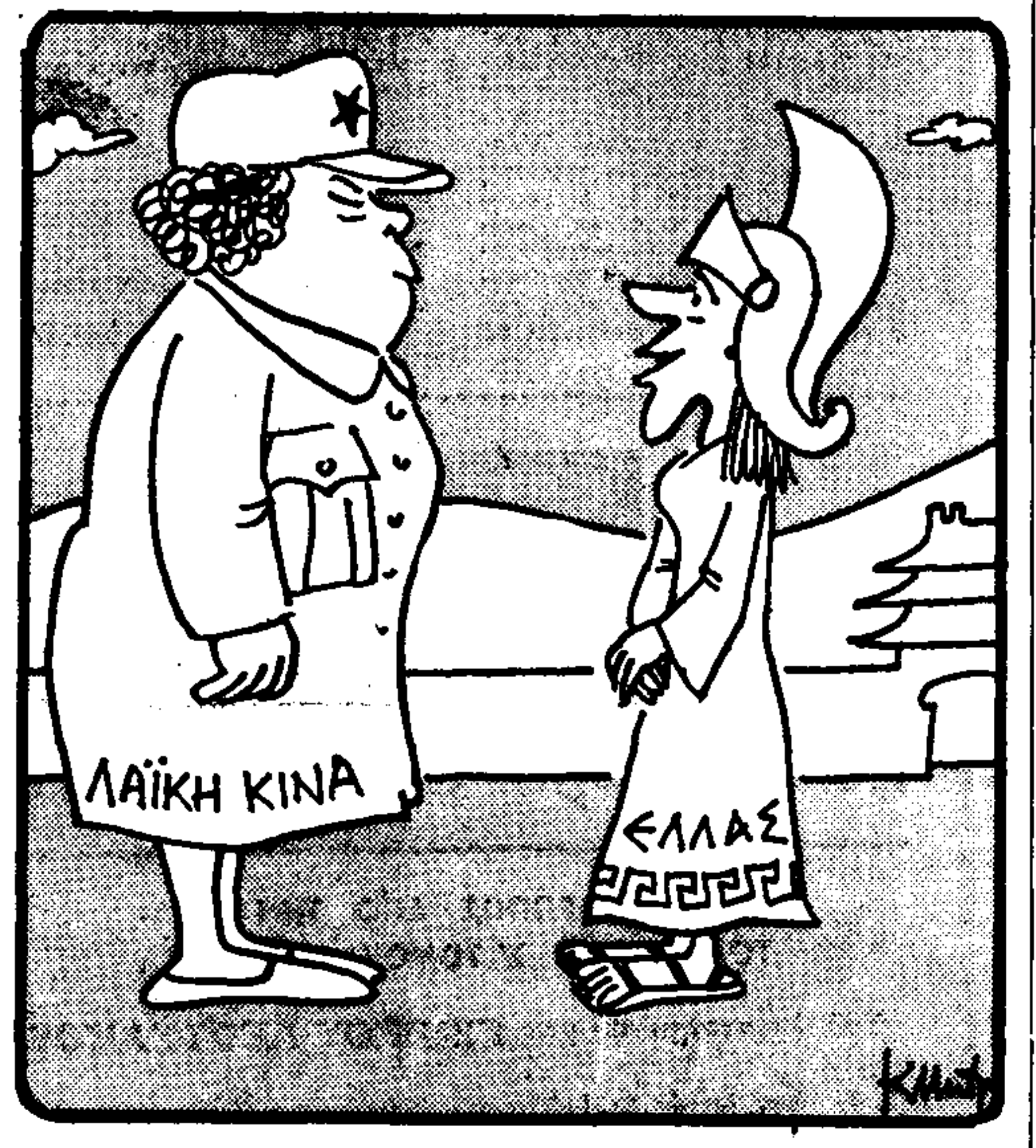
— Ό, τί δέλω! Καί σεις κοπέλλο! (Τού Κώστα Μητρόπουλου)

Η υπόθεση του ματαιωθέντος στασιαστικού κινήματος στο Πολεμικό Ναυτικό, διερευνάται από τις στρατιωτικές και τις δικαστικές αρχές, ενώ η κυβέρνηση μελετά τις πολιτικές προεκτάσεις του θέματος, θέσασα υπό τον φακό της έρευνής της, κυρίως τις τυχόν εσθινές του Βασιλέως Κωνσταντίνου. Είναι άγνωστο μέχρις ώρας αν υπάρχει στα χέρια των υπευθύνων κανένα στοιχείο, από το οποίο να προκύπτει ανάμιξη του Βασιλέως στην ενέργεια, αλλά είναι βέβαια, ύστερα απ' τις χθεσινές ανακοινώσεις του ύφυπουργού κ. Βύρωνος Σταματοπούλου, ότι οι υπόνοιες της κυβερνήσεως στρέφονται και προς την κατεύθυνση της Ρώμης. Είναι, έξ άλλου, χαρακτηριστικό ότι άρθρογράφος φιλοκυβερνητικής έφημερίδος καλεί τον Βασιλέα σήμερα να αποδοκιμάσει αμέσως την απόπειρα, να δηλώσει ότι «τά συμβάντα συνετελέσθησαν εν αγνοία του» και να καλέσει Στρατό, Ναυτικό και Αεροπορία σε πλήρη ύπακοη στην κυβέρνηση, διότι «τά περιθώρια έχουν πλησιάζει εις τόν όριον της έξανάλησεως». Καί διότι «άν οιοδήποτε νίπομεν τάς χείρας μας».